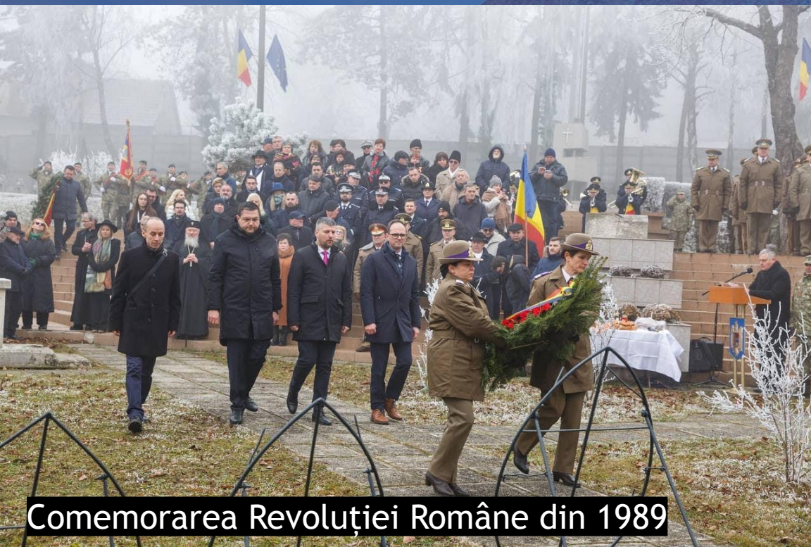
Comemorarea Revoluției Române din 1989