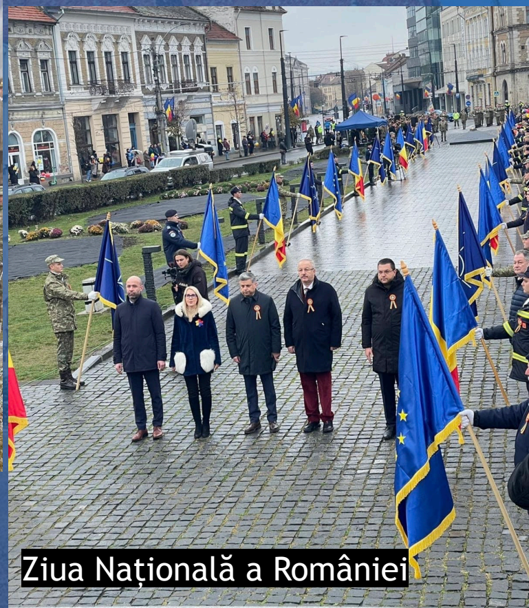
Ziua Națională a României