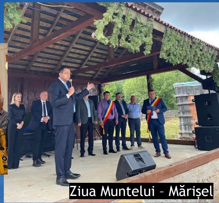
Ziua Muntelui - Mărișel