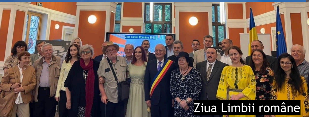
Ziua Limbii române